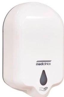
DJ0050A Acabado blanco