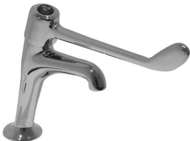
Figure 1: 504-21B