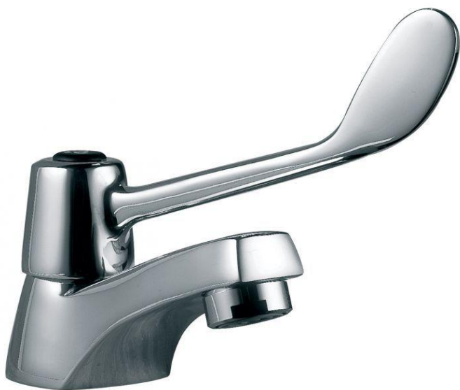
Figure 1: 505-21B