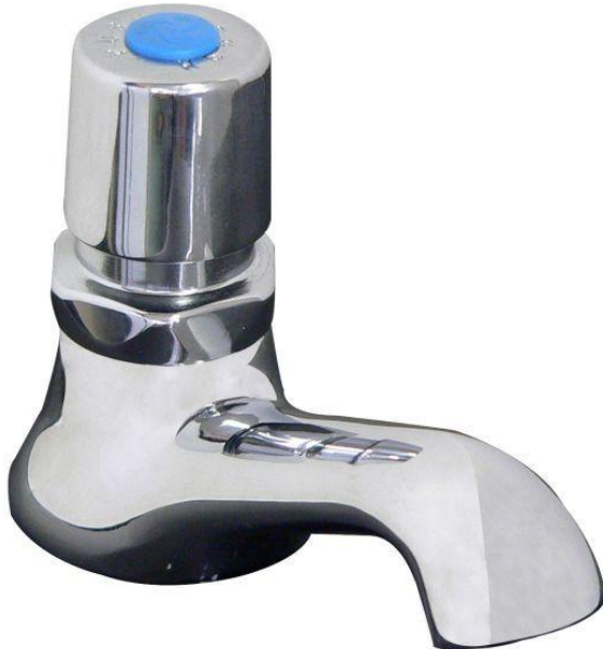
Figure 1: KM2-102